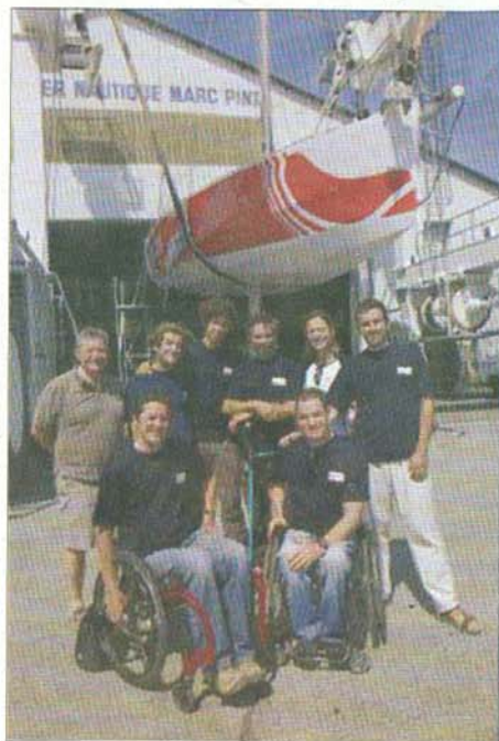
Les membres de l'équipe du projet Défi Intégration dont un aveugle et un unijambiste