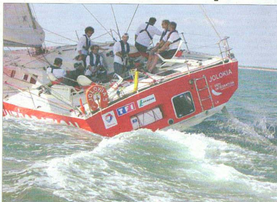
Le voilier Jolokia a été adapté pour la sécurité et la performance des membres de l'équipage, dont deux personnes handicapées