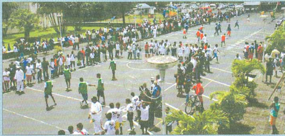
Ils étaient plus de 2 000 jeunes rassemblés à Curepipe le week-end dernier