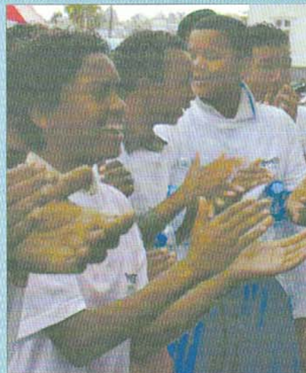
Parents et amis ont accompagné les joueurs