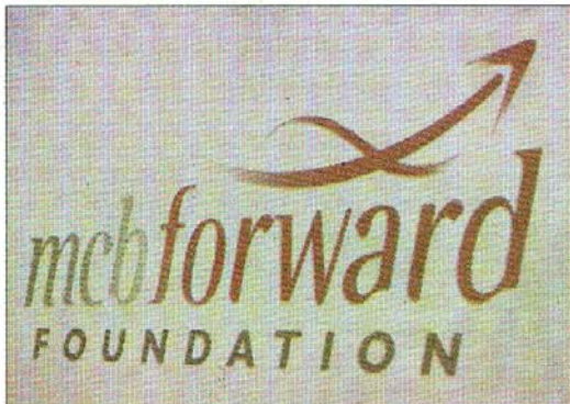
Le logo de la MCB Forward Foundation

Les deux précédents appels lancés par la MCB en 2008 et 2009 ont permis de financer un total de 79 projets pour un montant cumulé de Rs 30,8 M.